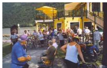
Donauradwanderung nach Schlögen