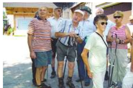
Wanderung zum Friedenskreuz